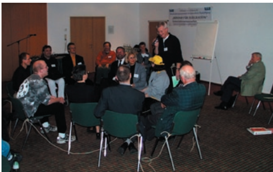
Auf der Abschlussveranstaltung „Bündnis für Integration“: Ein Netzwerk wird geknüpft

Die Vielfalt der Angebote hatte ihren gemeinsamen Nenner im Motto der Tagung „Bündnis für Integration - Partnerschaften ausbauen und Netzwerke bilden“. Neben der Vermittlung fachlicher Kenntnisse und dem Informationsaustausch war es ein zentrales Anliegen, den herausragenden Stellenwert der Vernetzungsarbeit im Bereich der beruflichen Integration zu dokumentieren. In diesem Zusammenhang sollte - ausgehend von dem Konzept „Case- bzw. Fallmanagement“ (vgl. impulse Nr. 17, 10/2000, S. 40ff.) - die zentrale Funktion der Integrationsfachdienste (IFD) deutlich werden. Dies nicht zuletzt deshalb, da die aktuelle finanzielle Ausstattung der IFD, nach Angaben der Bundesanstalt für Arbeit, auf den Erfahrungen der Schwerbehindertenvermittlung der Arbeitsämter beruht. Zwar stimmt das übergeordnete Ziel von Arbeitsvermittlung und IFD