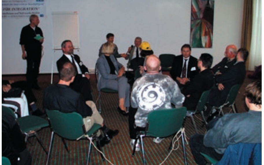
Auf der Abschlussveranstaltung "Bündnis für Integration": Ein Netzwerk wird geknüpft

Personenkreis der IFD sind Schwerbehinderte mit einem „besonderen Bedarf an arbeits- und berufsbegleitender Betreuung“ (vgl. § 109 SGB IX). Außerdem beinhaltet die Aufgabenstellung der IFD - wie in § 110 SGB IX festgehalten - mehr als die ausschließliche Vermittlung. Aufgrund der besonders schwer auf den Arbeitsmarkt zu integrierenden Zielgruppe gehört zu den Aufgaben der Dienste u.a. Akquisition von Arbeitsplätzen und Erstellen eines Fähigkeitsprofils, Vorbereitung auf den und Begleitung am Arbeitsplatz, Beratung der schwerbehinderten Menschen und Arbeitgeber sowie Nachbetreuung und Krisenintervention. Diese elementaren Bausteine der beruflichen Integration wurden nicht zuletzt aufgrund entsprechender Erfahrungen und empirischer Ergebnisse aus Modellprojekten der 90er Jahre gesetzlich verankert. Personenkreis und Aufgabenstellung erfordern deshalb auch eine „andere“, d.h. höhere finanzielle Ausstattung der Fachdienste, als dies aktuell gegeben ist. Eine Orientierungsgrundlage dazu bietet z.B. die Finanzierung der Modell-IFD durch die Integrationsämter in Baden-Württemberg und Nordrhein-Westfalen in den 90er Jahren. Die finanzielle Ausstattung der IFD ist in erster Linie durch die Notwendigkeit bedingt, fachlich fundiert ausgebildetes Personal einzustellen und zu halten. Bei der skizzierten Aufgabenvielfalt können dies nur Fachkräfte mit einer möglichst breitgefächerten Qualifikation sein. Dies ist eine wesentliche Voraussetzung, um den gesetzlich bestimmten Auftrag qua-