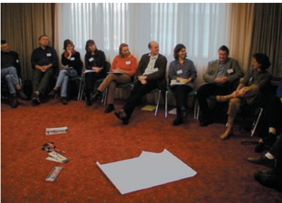
TeilnehmerInnen im Workshop "Zukunftswerkstatt"